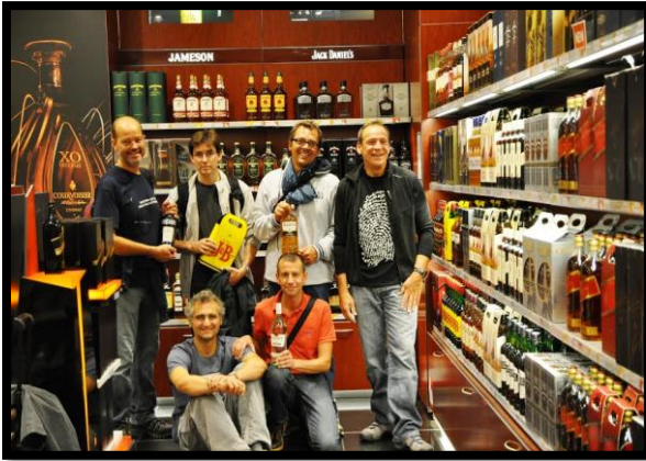
Un équipage de choc